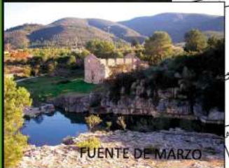
FUENTE DE MARZO