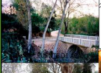
FUENTE DE ABAJO