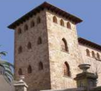
Castillo-Palacio Condes de Cervellón