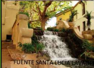
FUENTE SANTA LUCÍA LAVADERO