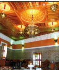
Castillo-Palacio Condes de Cervellón