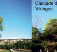
Cascada de los Vikingos