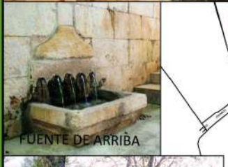
FUENTE DE ARRIBA